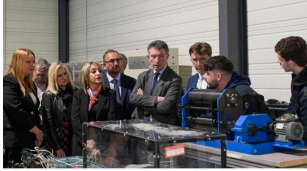
Visite par Franck Leroy, le président de la région Grand Est, du plateau technique.

Que faites-vous ? D'où êtes-vous ?... Franck Leroy circule dans les travées du plateau technique, échange avec les apprentis. Le président de la région Grand Est découvre les nouveaux locaux du pôle formation de l'UIMM (Union des industries et métiers de la métallurgie) qu'il a inauguré quelques instants plutôt.