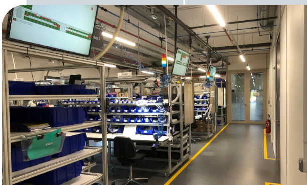
Cellule de fabrication. ELDEC, Saint-Priest (69)

Le projet « Localisation » de cette PME de 32 salariés consiste à sortir de la crise par le haut tout en préservant les compétences en France. Pour ce faire, ELDEC rapatrie une cellule de fabrication de capteurs actuellement produits aux États Unis, modernise ses équipements et diversifie une partie de sa production. Une opportunité pour pérenniser à long terme son activité dans la région Auvergne-Rhône-Alpes.