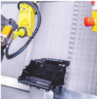
54B15 - V1